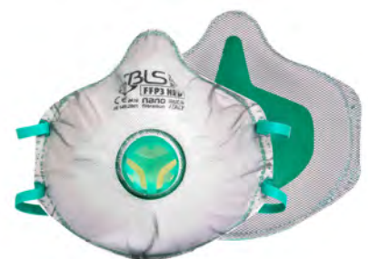
BLS Zer0 31 BLS Zer0 31 C