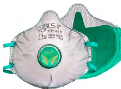
BLS Zer0 30 BLS Zer0 30 C