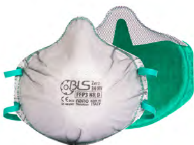
BLS Zer0 30 NV